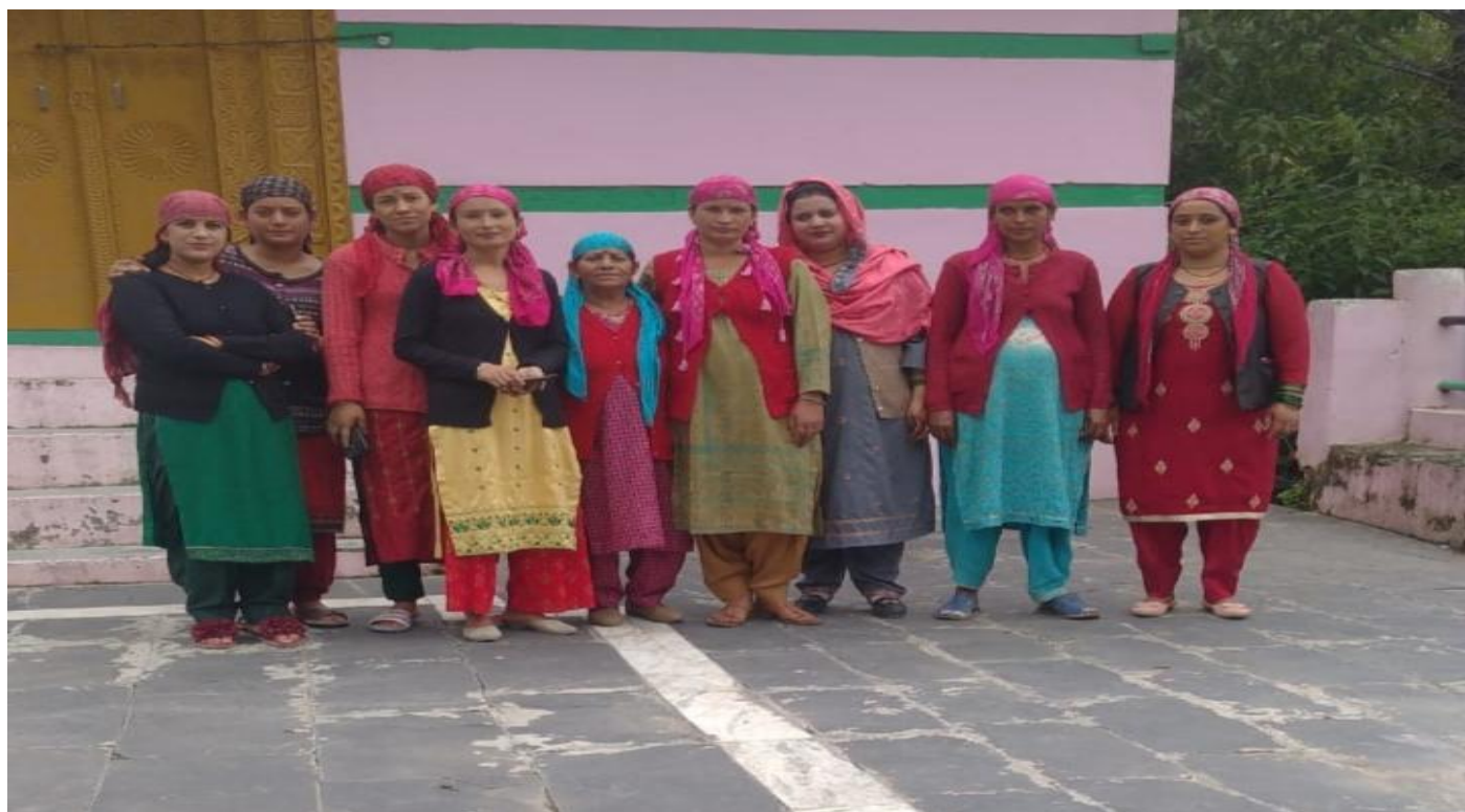
गायत्री समूह के सदस्य